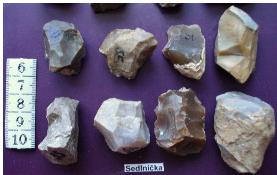
obr. 1 - 9