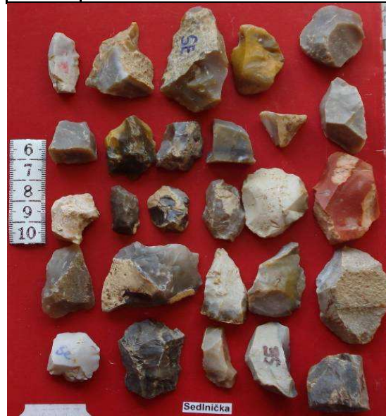
obr. 15, 16